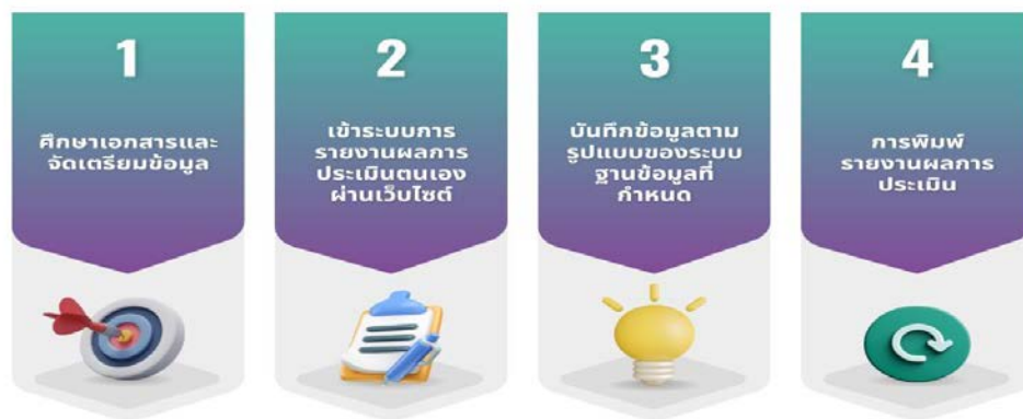
ภาพที่ ๖.๑ การรายงานผลการประเมินตนเองผ่านระบบออนไลน์